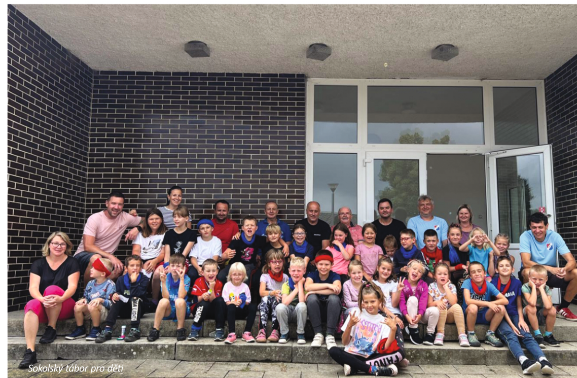
Sokolský tábor pro děti

Tiskne JIPRINT, s. r. o., Kosovská 26, 586 01 Jihlava. IČO: 46901736 Odpovědný redaktor: Petra Smejkalová. Technická redakce: Martina Doležalová. Příspěvky přijímá Obecní úřad Puklice. Neprodejný výtisk.