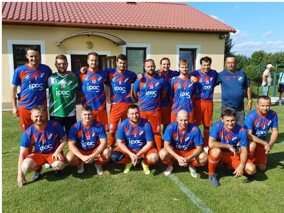
nové fotbalové dresy pro sezonu 2025/2026 (PUKLICE „A“)